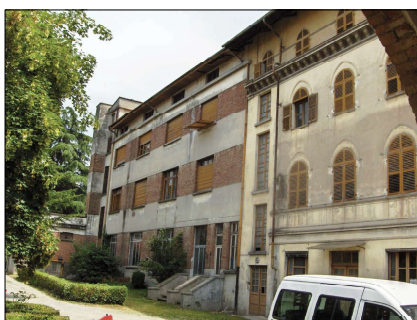
EX SECONDA CASA SUORE E LAVANDERIA