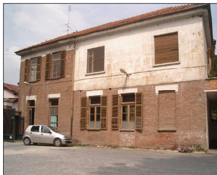
FABBRICATO EX PORTINERIA