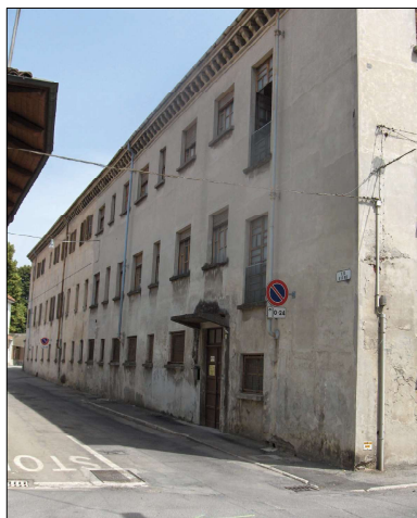
EX CASA SUORE, MAGAZZINO VESTIARIO

VIA FIUME N.22 - VIA GIOVANNI PRIOTTI N.37