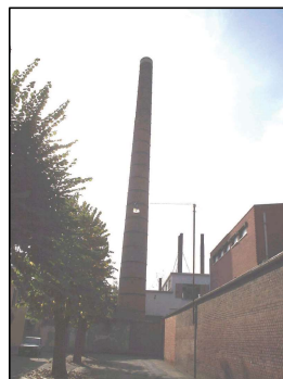
CIMINIERA (ora in parte demolita)